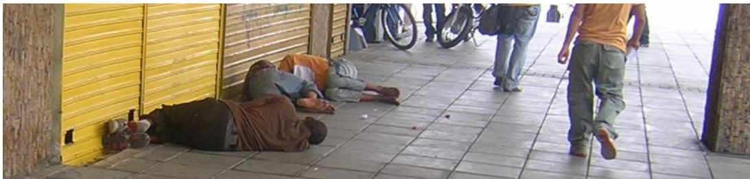
(NNAJSC de Pereira –Colombia-, Autor: Jose Alvarez B)

“Otro mundo es posible si cambiamos nosotros primero”.